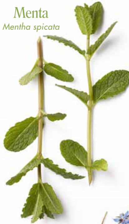
Menta Mentha spicata