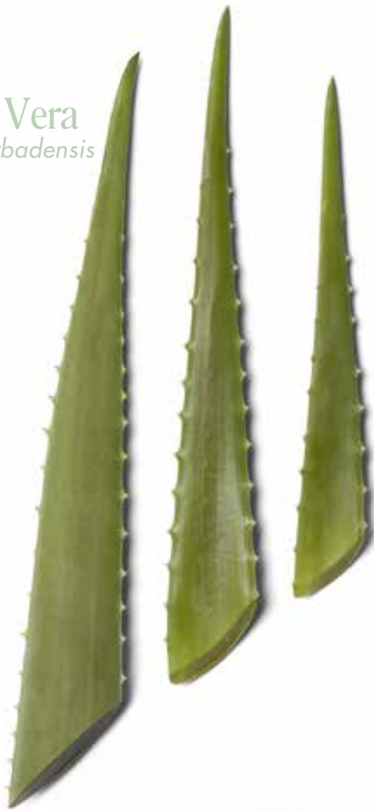
Áloe Vera Aloe barbadensis