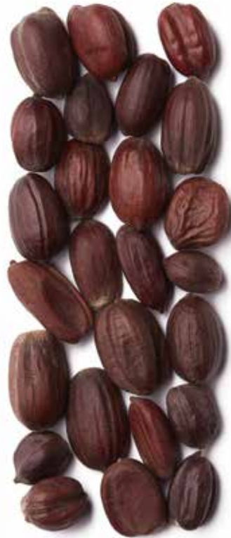
Jojoba Simmondsia chinensis