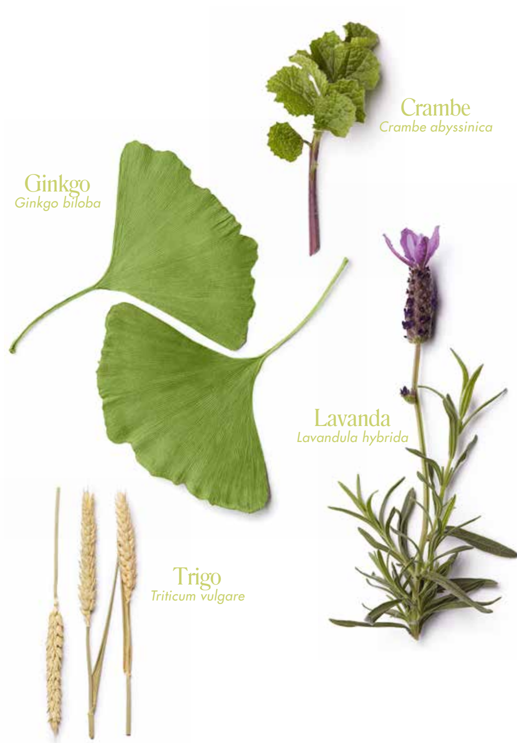
Ginkgo Ginkgo biloba