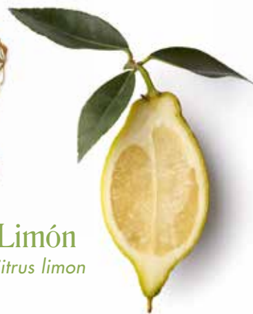
Limón Citrus limon