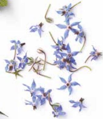
Borraja Borago officinalis