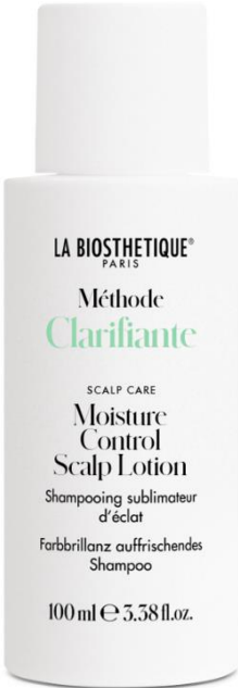
Refreshing Aroma Complex